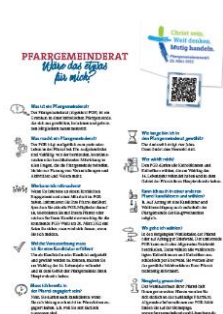
Schaubild „Pfarrgemeinderat: Wäre das etwas für mich?“

Wie kann der Pfarrgemeinderat kurz, knapp und anschaulich erklärt werden, und für eine Mitarbeit im Rat geworben? Hierzu haben wir uns Gedanken gemacht und das Ergebnis ist das benannte Schaubild.